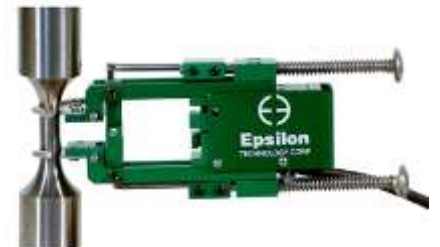
Extensómetros de contacto