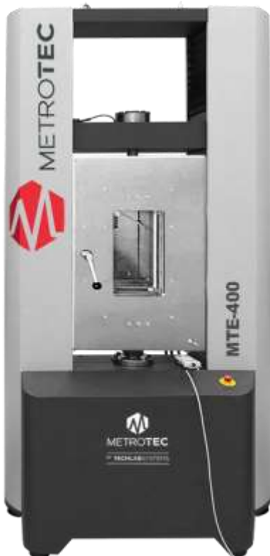
Cámaras Térmicas de Ensayos a diferentes temperaturas