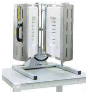
Hornos Ensayos Altas Temperaturas (Entre 1100 y 1500 °C)