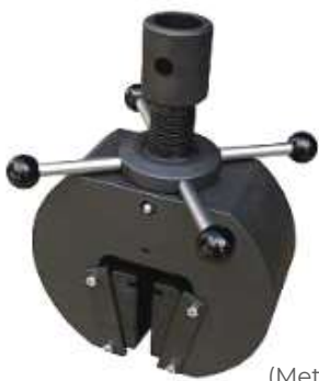
Mordazas tipo Cuña (Metales - Plásticos - Alambres -Cables - Composites..)

¡ Consúltenos sus necesidades de ensayos !